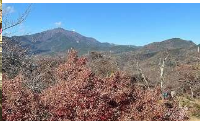
左 大山 右 高取山 弘法山展望台より